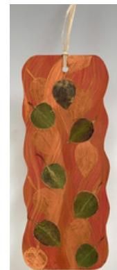
Segnalibro Foglia tempo