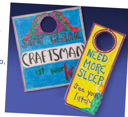
Segnalino per la porta