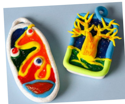
Ciondoli speciali per il tempo insieme